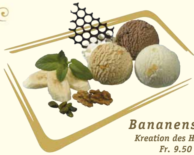
Bananensplit Kreation des Hauses Fr. 9.50