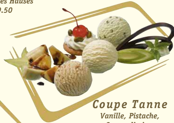
Coupe Tanne Vanille, Pistache, Caramelissimo mit Amarena Kirschen Fr. 10.50