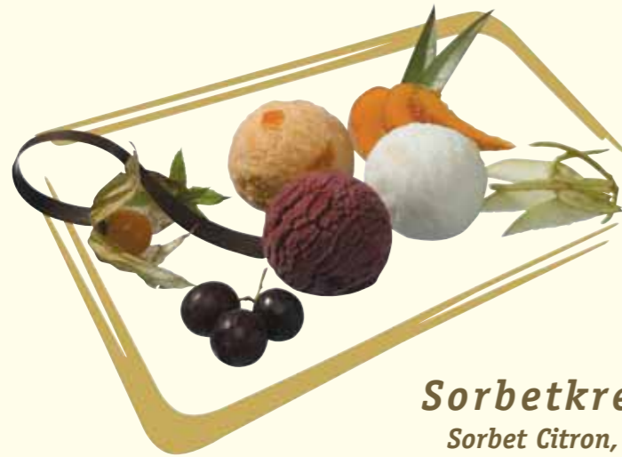
Sorbetkreation Sorbet Citron, Orange, Aprikose Fr. 10.50